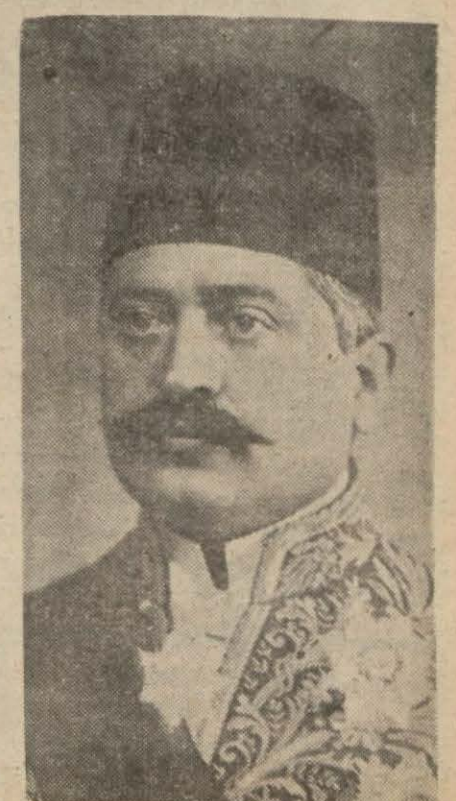
Rahmetli Talât Paşa

Talât Paşa bir harb kaybetmiş bir hükümetin sadrazamı idi. Onun bu felâketteki mes'uliyet hissesi üzerinde münakaşa edilebilir, fakat her münakaşanın üstünde olan bir hakikat varsa büyük bir vatansever oluşu ve bu memleket için en temiz dilekler. (Devamı 7 ncı sayfada)