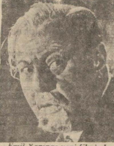
Emil Yanings yeni filminde

Büyük san'atkar Emil Yanings yeni bir film çevirmiştir.