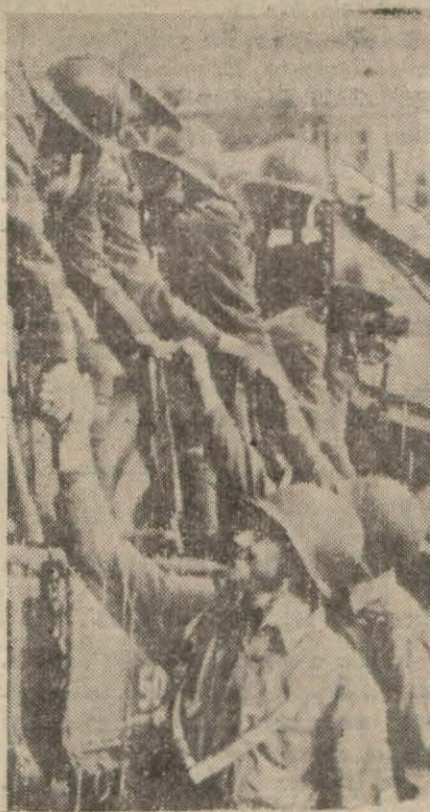
Fransız askerleri Tunus cephelelerine gitmeden evvel Cezayirde Amerikan askerleri ile vedalaşırken

Kahire, 14 (A.A.) — Royterin hususi muhabiri bildiriyor: (Devamı 3 üncü sayfada)